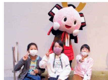
休憩時間、くにももたんと一緒に

少年仲間づくり教室第5回活動「心ふれあい音楽鑑賞教室」が11月3日、ふくしん夢の音楽堂で行われ、教室生19名が生徒のオーケストラを鑑賞しました。大迫力のオーケストラの響きに始めは少し緊張気味だった教室生も、馴染みのあるジブリの曲などが演奏されると、手拍子をしながら楽しそうにリズムをとる姿が見られました。演奏終了後、教室生から