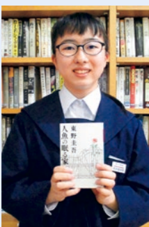
「人魚の眠る家」 東野圭吾著 幻冬舎

みなさんは、「愛」という言葉にどんなイメージを持っていますか。人と人をつなぐ、幸せな気持ち