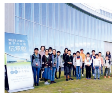
親子で震災や復興を考える1日に

町民移動教室では10月25日、18名の親子が双葉町の東日本大震災・原子力災害伝承館を見学しました。参加した子どもたちは、震災当時の実写映像や展示されている被災した実物資料をじっくり観察し、メモを取りながらアテンダントスタッフの「思い」を真剣に聞いていました。その後、いわき市アクアマリンふくしまへ移動し、水族館職員から震災当時の津波や復興