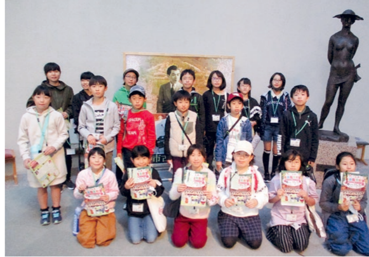
みんなで楽しく鑑賞しました

少年仲間づくり教室第5回活動「心ふれあい音楽鑑賞教室」が11月3日、ふくしん夢の音楽堂で行われ、教室生19名が生徒のオーケストラを鑑賞しました。大迫力のオーケストラの響きに始めは少し緊張気味だった教室生も、馴染みのあるジブリの曲などが演奏されると、手拍子をしながら楽しそうにリズムをとる姿が見られました。演奏終了後、教室生から