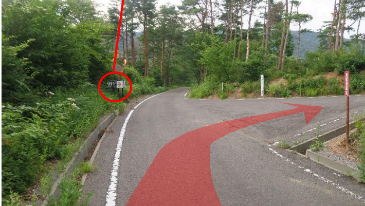
【ポイント5】看板を目印に、右折します。