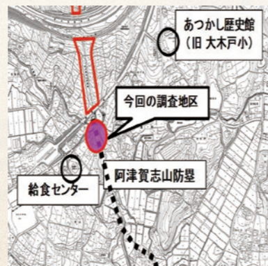
第26次発掘調査地区

今回の調査である東・西国見地区は、古代の東山道と防塁が交差する地点を含んでおり、奥州合戦における頼朝の進軍において、防塁突破地点と予想された地区でもあります。突破に際しては、工作隊による防塁の切り崩しと埋め立てが行われたとの記録があり、今回の調査ではその痕跡調査も目的の一つとしました。