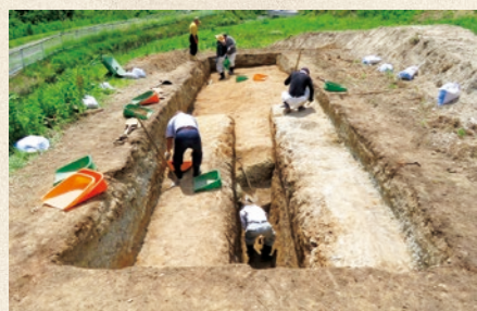
発掘調査の作業状況

調査の結果、2か所で防塁の外堀と考える遺構が検出されましたが、一部後世の国見石採掘により改変されている様子が確認されました。また、外堀は鋭角の逆三角形（深さ約2m）となっており、防御に優れた構築であることを再確認しました。