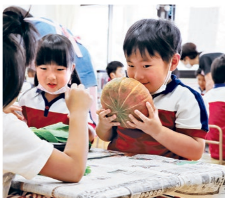
旬の食材に触れる子どもたち