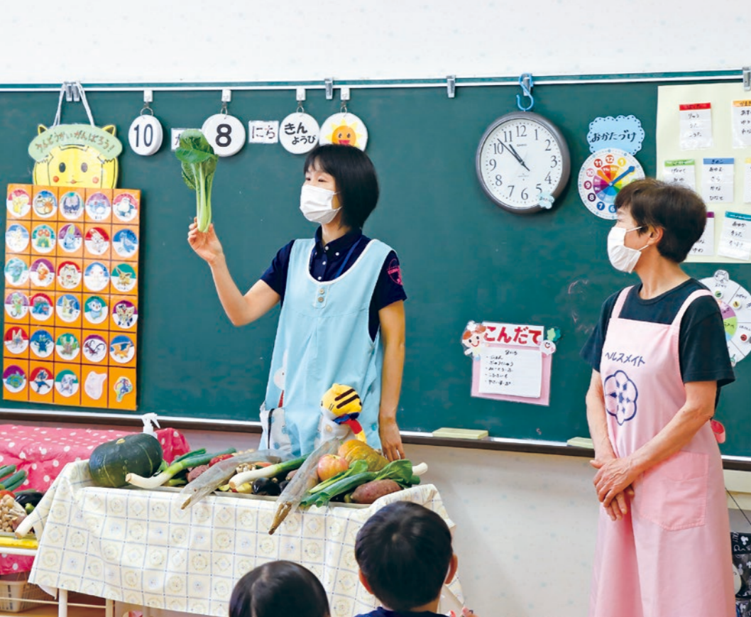
くにみ幼稚園で定期的に行われる「食育教室」

食育は、知育・徳育・体育の基礎となり、さまざまな経験を通じて「食」に関する知識と「食」を選択する力を習得し、健全な食生活を実現することができる人間を育てます。