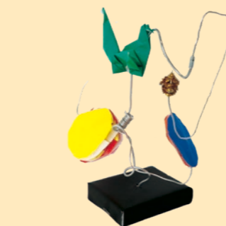
八島 奎祐「つるからみた宇宙」