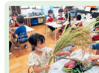
旬の食材に触れました(年長組)