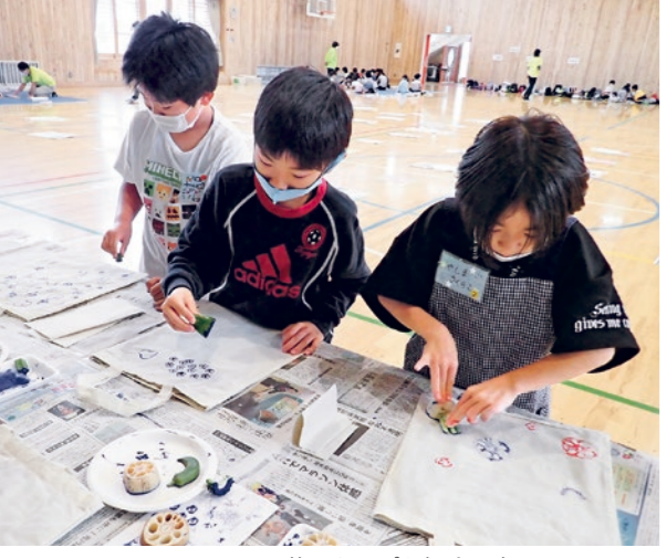
思い思いの野菜スタンプを押す児童

国見つ子わんぱく広場では10月9日に児童51名が参加し、野菜スタンプを押したエコバック作りを行いました。テーブルにはレンコン、オクラ、ピーマンなど様々な種類の野菜が並べられ、児童らは迷いながらも好きな野菜を手に取り、楽しみながらスタンプを押しました。 また、スタッフや友達に自分の作品について話をし