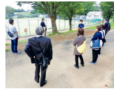
現地視察も行いました

会を設置し、町ならではのクラブの在り方について随時検討を進めています。 9月25日には5回目の委員会が開催され、かがみいしスポーツクラブ(鏡石町)といわしろふれあいスポーツクラブ(二本松市)を視察しました。 現地のクラブマネジャーに活動施設を案内していただいたり、クラブ設立までの経緯や現在のクラブ運営の状況について説明していただきました。 また、10月14日に開催された6回目の委員会では、