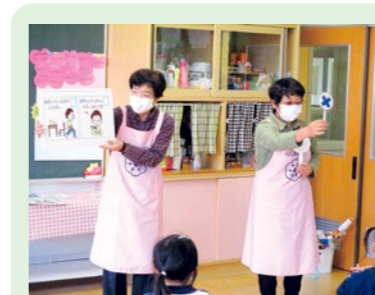
食事のマナーを学びました(年中組)