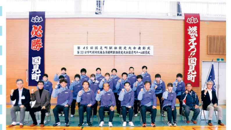
応援よろしくお願ひします!