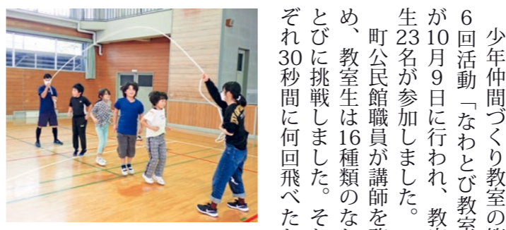
みんなで協力して「長縄跳び」

少年仲間づくり教室の第6回活動「なわとび教室」が10月9日に行われ、教室生23名が参加しました。 町公民館職員が講師を務め、教室生は16種類のなわとびに挑戦しました。それぞれ30秒間に何回飛べたかをチャレンジカードに記録し、ごほうびシールを貼りました。飛び方が分からない「かえしとび」もあり、講師の指導の下、真剣に取り組まれました。 後半は、2班に分かれて長なわとびを実施しました。班ごとに意見を出し、さまざまな飛び方を工夫して楽しみました。 最後には、2本の縄を回して飛ぶ「ダブルダッチ」に挑戦し、失敗しても何度も取り組む姿が見られました。