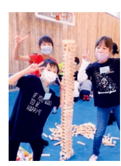
「高く積み上げたよ!!」

国見つ子わんぱく広場では10月9日に児童51名が参加し、野菜スタンプを押したエコバック作りを行いました。テーブルにはレンコン、オクラ、ピーマンなど様々な種類の野菜が並べられ、児童らは迷いながらも好きな野菜を手に取り、楽しみながらスタンプを押しました。 また、スタッフや友達に自分の作品について話をし