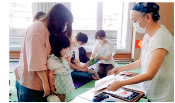
たくさんの絵本とふれあいました

子ども司書活動では10月2日に「よみきかせみずく」の皆さんによる、「おはなし会」を鑑賞しました。おはなし会に参加した未就学児の親子と一緒に、対象年齢別に合わせた大型絵本などのよみきかせを楽しみました。 鑑賞を終えた子ども司書からは「小さい頃に読んでもらった大好きな絵本だったので嬉しかった」「語りかけるように読んでいてすごいと思った」という素直な感想が聞かれ、今