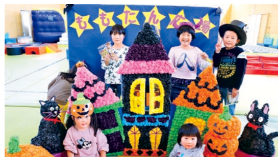
宝物 (お菓子) を見つけて笑顔の子どもたち

当日はあいにくの雨模様でしたが、奉仕作業には同センター会員 50 名が参加し、施設周辺の草むしりやごみ拾いを行いました。この取り組みは、毎年 10 月 15 日のシルバーの日に合わせて行われています。