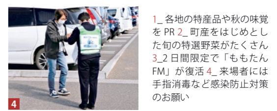
1_各地の特産品や秋の味覚をPR 2_町産をはじめとした旬の特選野菜がたくさん 3_2日間限定で「ももたんFM」が復活 4_来場者には手指消毒など感染防止対策のお願い