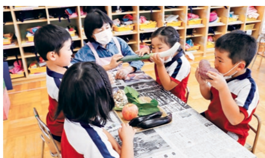
五感を使って食材を観察