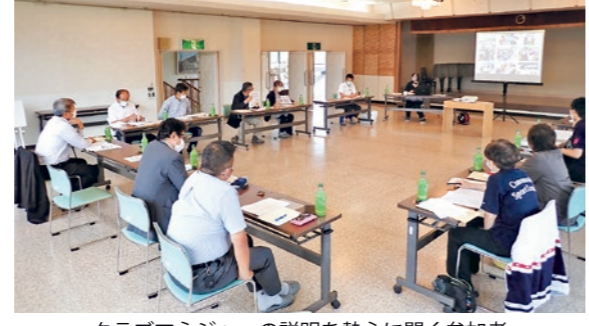
クラブマネジャーの説明を熱心に聞く参加者

総合型地域スポーツクラブは、自主運営のもと「いつでも」「誰でも」「好きなレベルで」「世代を超えて」「いろいろなスポーツを」「いつまでも」楽しむことができる地域のスポーツコミュニティ団体です。体育面のみならず文化活動や保健・福祉の観点からも健康づくりが期待されています。 町では、総合型地域スポーツクラブ設立検討委員会