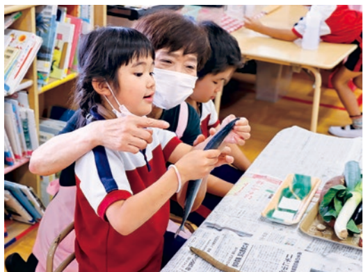
生のサンマも手づかみで観察