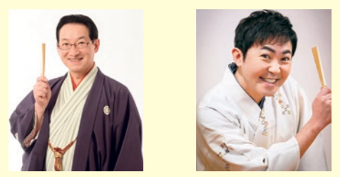
落語 春風亭昇太 落語 林家三平

日時 令和4年2月2日(日) 開演 18:30 (開場 18:00) 会場 観月台文化センター ホール 全席指定 前売 2,000円 (当日 2,500円) 12月4日(日) 9:00 前売開始