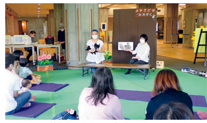
絵本だけでなく人形も使ったよみきかせ

子ども司書活動では10月2日に「よみきかせみずく」の皆さんによる、「おはなし会」を鑑賞しました。おはなし会に参加した未就学児の親子と一緒に、対象年齢別に合わせた大型絵本などのよみきかせを楽しみました。 鑑賞を終えた子ども司書からは「小さい頃に読んでもらった大好きな絵本だったので嬉しかった」「語りかけるように読んでいてすごいと思った」という素直な感想が聞かれ、今