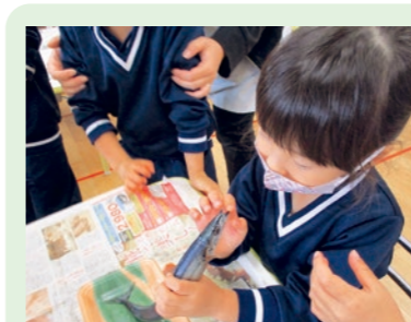
食材をよく観察しました(年少組)

町では、食生活改善推進員のみなさんと栄養士が、くにみ幼稚園の子どもたちを対象に食育教室を開催しています。10月は次の内容で実施しました。