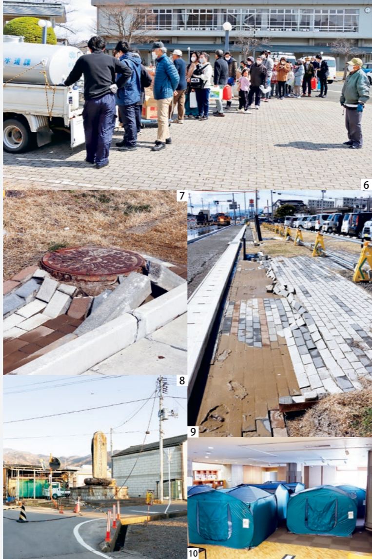
1_倒壊した旧小坂村産業組合石蔵 2_地震発生直後、情報収集にあたる職員たち 3_続々と集められる災害情報 4_漏水が発生した小坂踏切前 5_被害を受けた道の駅国見あつかけの郷 6_観月台文化センターでの応急給水活動 7_隆起したマンホール 8_断線して垂れ下がった電線 9_液化化した役場駐車場 10_避難所となった観月台文化センター 11_被害状況の視察に訪れた内堀雅雄福島県知事(左) 12_罹災・被災証明書の発行受付 13_甚大な被害を受けた東北新幹線の架線柱や橋脚

町では地震発生後すぐに職員が庁舎へ参集し、避難所開設や被害状況の確認のため国、県、消防団、警察署、消防署などの関係機関と連携して対応にあたりました。