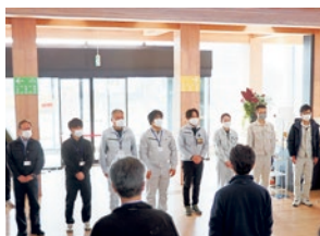
▲応援職員の皆さん (28日撮影)

保育所と幼稚園を除く町職員は104人。でも他所に力を貸してくれる人たちがいる。「助けてください」と言う勇氣の大切さを知る。