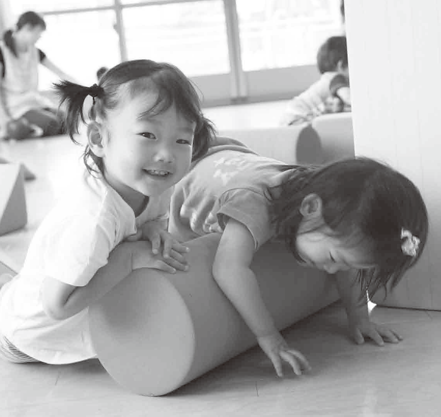
もっとたくさん遊べるよ(藤田保育所)