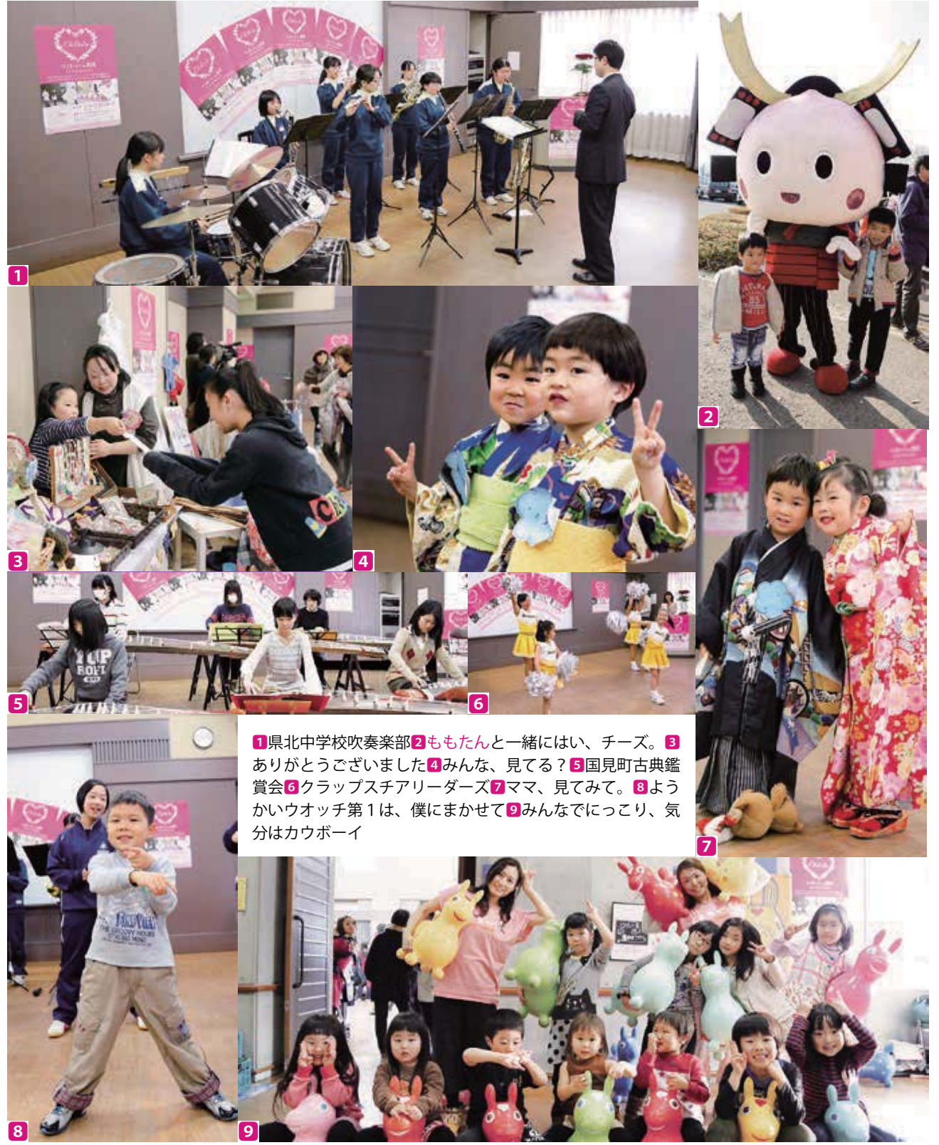
1 県北中学校吹奏楽部 2 ももたんと一緒に、チーズ。 3 ありがとうございます 4 みんな、見てる? 5 国見町古典鑑賞会 6 クラブスチアリーダーズ 7 ママ、見てみて。 8 ようかいウオッチ第1は、僕にまかせて 9 みんなでにっこり、気分はカウボーイ