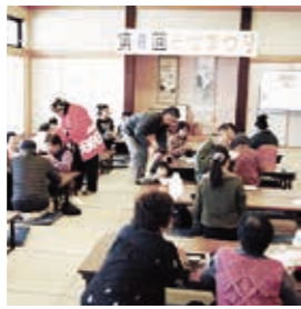
昨年のそばまつり

今年も恒例の「そばまつり」を11月23日(日)午前9時から小坂総合農村管理センターで開催します。純小坂産のおいしい「十割そば」のほかにも美味しい食べ物や沢山用意し、お待ちしております。 また、当日はおやじバンドの演奏、キャンドルの手作り教室も開催されます。