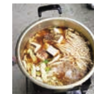
県北中学校芋煮会での料理 料理名は「すき焼き」