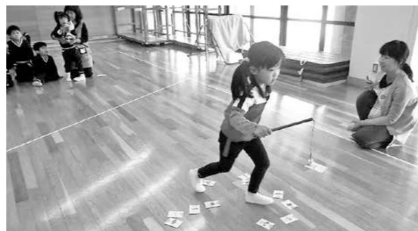
年中組 テーマ「食べ物当てゲーム〜クイズの答えを釣り上げよう〜」