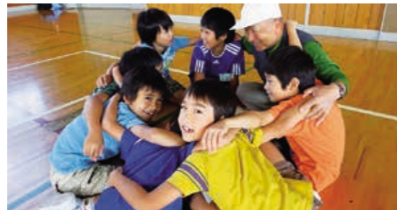
心は一つ、男同士がんばろう

を触ったり、肩を組んだり、いつのまにかおじいちゃんおばあちゃんと仲良くなり、グループができました。その後、ラダーゲッター、日レクボールなどのニュースポーツを体験しました。おじいちゃんおばあちゃんのやさしさ、温かさに触れ、楽しく穏やかな時間を過ごしました。