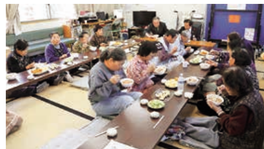
あったかい いもじるたべて にこにこね