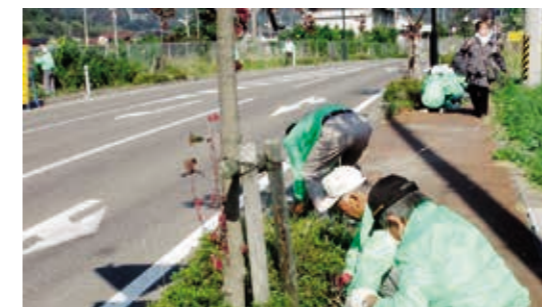
あせかいて みんなえがおで くさむしり