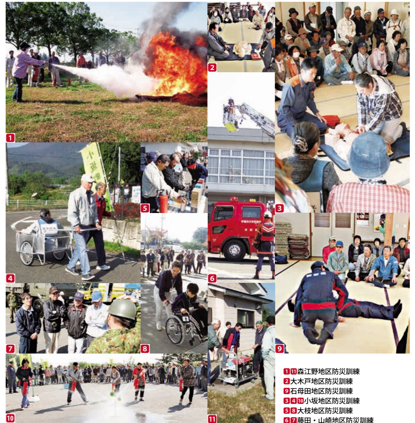
① 森江野地区防災訓練 ② 大木戸地区防災訓練 ③ 石母田地区防災訓練 ④ ⑩ 小坂地区防災訓練 ⑤ ⑧ 大枝地区防災訓練 ⑥ ⑦ 藤田・山崎地区防災訓練