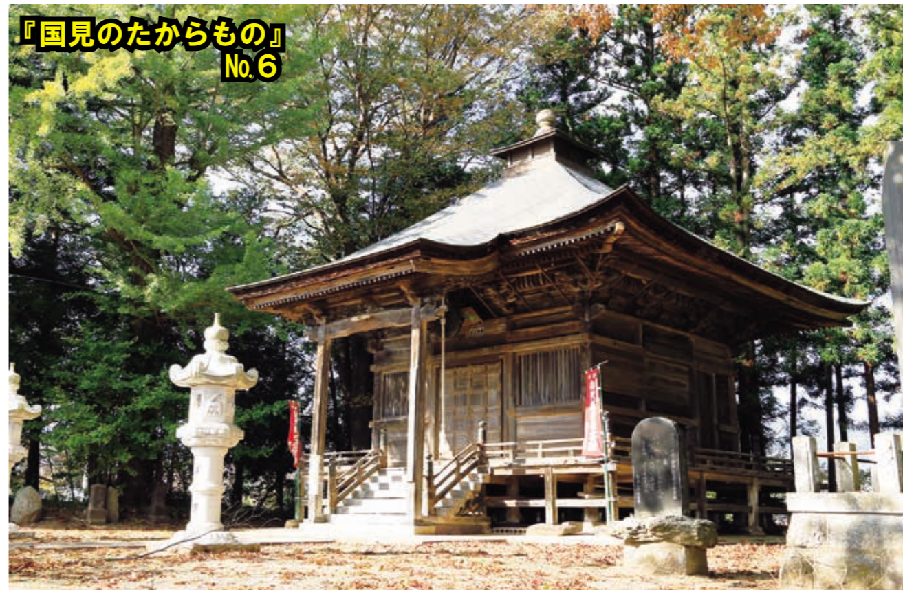
『国見のたからもの』 No.6