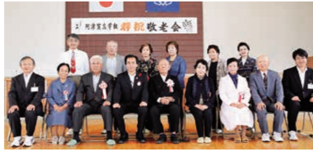
賀寿受賞の皆さん