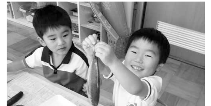
みんな、この魚知ってる？