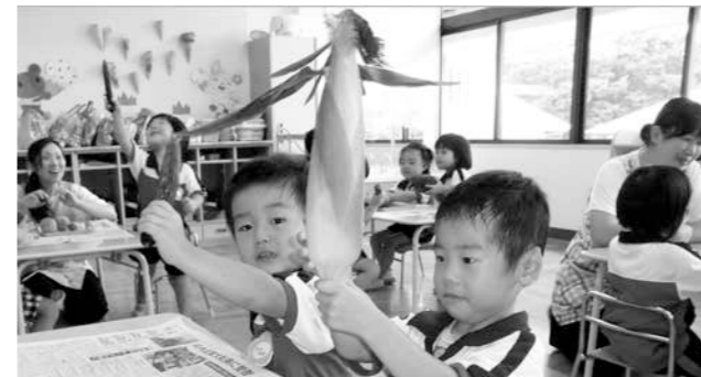
皮の中は、何が入ってるのかな？