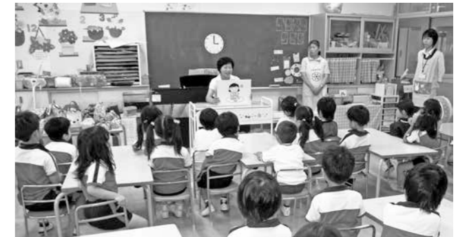
みんなでおやつについて考えてみよう！

町では食生活改善推進員の皆さんと栄養士が出向いて、くにみ幼稚園の子ども達を対象に食育教室を7月は7回実施しました。