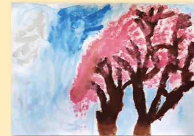
比金 日向 【青空にうかんで見えるさくら】