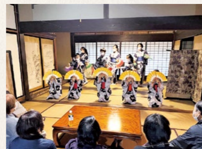
文化財の新たな活用も始まっています