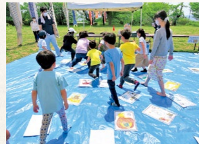
5月5日「あつかし歴史館こどもの日」のイベントでは多くの子どもの歓声が響きました

現在の計画は、令和6年度に終期を迎えます。計画の成果を総括し、今後の「歴史まちづくり」をどのように進めるのか、これからさらなる議論が必要になります。町では多くの方に歴史まちづくりに関わっていただきたいと考えています。町民の皆さまからもぜひ意見をお待ちしています。