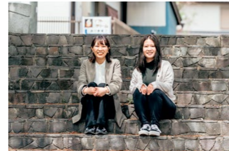
4月から着任した関係人口創出チームのふたりです！ 今後ともよろしくお願いいたします。

どちらも、時間をかけて国見のまちについて思考・実践したり、地元の人にしか分からないような国見の細かな良さを広めたりと、じっくり国見と関わることでできる機会になるのではないかと思います。ぜひ、どちらにも注目していただけたいと思います！