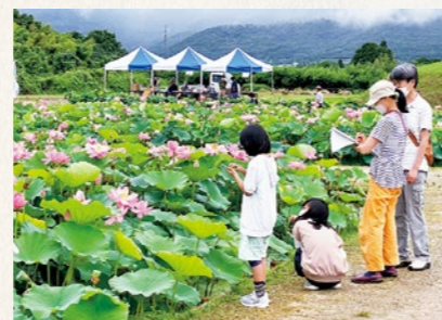
あつかし千年公園の中尊寺ハスは、毎年多くの方が訪れる国見町の観光スポットとなりました