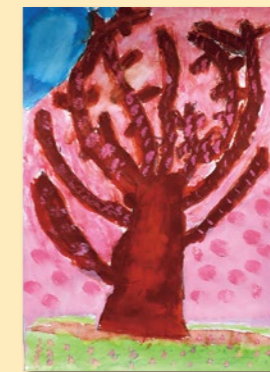
【花びらがまうさくらの木】 渡邊 旭柊