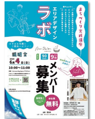
エリアデザインラボは今年で4年目を迎えます

現在は「エリアデザインラボ」の準備や、Instagramを使って国見を発信する企画を練っている最中です。