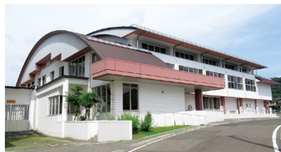
▲国見小学校体育館

藤田・山崎地区では観月台文化センターと国見小学校体育館が避難所となります。また、下表のとおり19か所の避難所を指定していて、避難状況や避難者数により順次開設します。