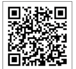
▲ハザードマップはこちら

災害の危険性が高まると、各自主防災会（各町内会）では一時避難所の開設、町では指定避難所の開設準備を始めます。各地区の指定避難所が開設されたときは、防災無線放送やLINE、町ホームページ・テレビ・ラジオでお知らせします。