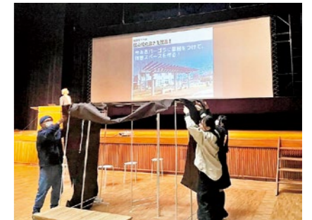
大道具などを用いた舞台づくりを工夫し雨風をしのげる屋根をその場で表現しました