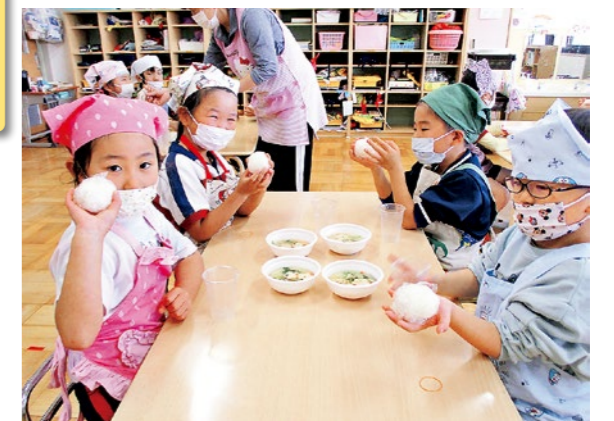
新米でおにぎりを作ろう(全員)