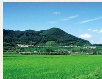
阿津賀志山の裾野に広がる田園風景は、町民の皆さんの心に残る、故郷の原風景です

国史跡「阿津賀志山防塁」は、町を代表する文化財です。しかし意義深いこの史跡も、華やかな城郭や美しい町並みなどと比べれば、魅力や集客力に限界があることは否めません。文化財を郷土の誇りとして、町民に受け入れてもらうためにはどのようなことが必要なのか、またどうしたら集客を図ることができるのか、この課題の答えを見つけることは容易なことではありません。