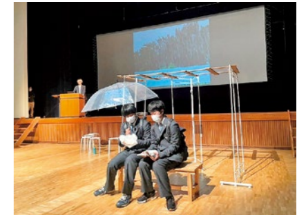
寸劇を交えた報告会の様子

今年は町内外の高校生や大人29人のメンバーを迎え、遊休化しつつある「藤田駅前広場」の活用について、アイデアを出し合ってきました。国見町やまちづくりに興味関心のある幅広い世代のメンバーが集まり、意見交換や交流できる場となっていた「エリアデザインラボ2023」。町民の皆さまに向けた活動報告会の実施は今年が初めての試みでしたが、ラボの取り組みを知っていただく、とても貴重な機会となりました。「エリアデザインラボ2023」の活動は2月まで続きますので、引き続きよろしくお願いたします！