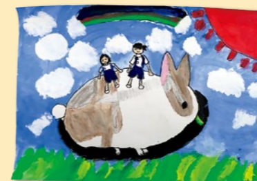
『かわいいうさぎといい気持ち』 実沢 果林