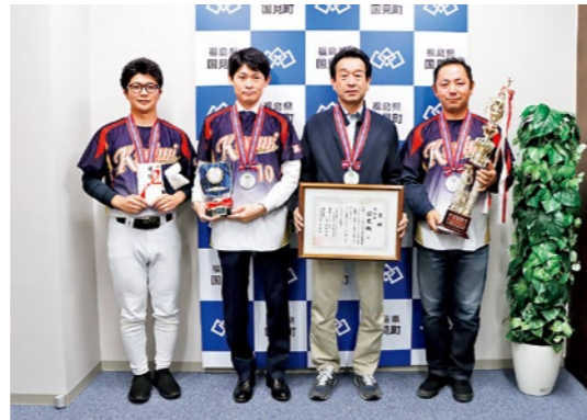
準優勝の報告に国見町役場を訪れた国見町チームの皆さん

昨年、初のベスト4を賭けた矢吹町戦で悔しい逆転負けを喫した国見町チーム。選手も応援席も勝利を確信していた試合の敗戦に、チームは雪辱を果たすべく冬の寒い時期から練習を実施しました。前回大会で悔しい思いをした国見町チームはこの日のために練習を重ね、町民の皆さんに勇気と元気を与える力強いプレーを見せてくれました。