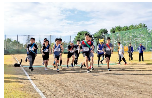
▲幅広い年代の選手たちが健脚を競いました

国見町で受け継がれてきた郷土料理を親子で学びながら調理し、国見産の新米と一緒に味わいました。