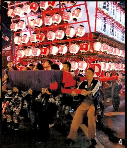
1_押し負けないように力を込める 2_軽快なお囃子が祭りを盛り上げる 3_真剣な表情で舞う稚児たち 4_山車を自由自在に操る若連衆(錦町) 5_迫力ある「もみ合い」に沿道から歓声があがる(本町) 6_若連衆の勇ましい掛け声が響き渡る(社元) 7_神輿の「宮入り」で祭りの盛り上がりは最高潮に 8_閉祭後も祭りの興奮は冷めない 9_何でもぶつかり合う山車と神輿(大町) 10_渾身の力を込めて山車を押す

国見町を代表する秋祭り「鹿島神社例大祭」が10月27日から28日にかけて、旧奥州街道藤田宿を中心に行われました。昨年は、コロナ禍の影響で規模を縮小しての実施でしたが、今年は子どもたちも参加し、以前と変わらない賑やかな祭りの風景が戻ってきました。 祭りの期間中は、軽快なお囃子の音色とともに神輿と4町若連の山車、稚児行列が町内を練り歩き、多くの人を魅了しました。 28日夜には、祭最大の見どころである「もみ合い」が行われました。2台の山車が、神輿を挟んで激しくぶつかり合う様子を間近で見ようと、多くの見物客が沿道に詰めかけました。 若連衆の勇壮な掛け声と、山車と神輿が何度もぶつかり合う轟音が響き渡るたびに、大きな歓声と拍手があがり、祭りの盛り上がりは最高潮に。大勢の観客が見守るなか神輿が鹿島神社へ還御を終えると、町は静寂に包まれ、祭りの幕が下ろされました。