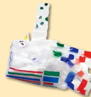
『うさぎかな』 菊地 陽夕