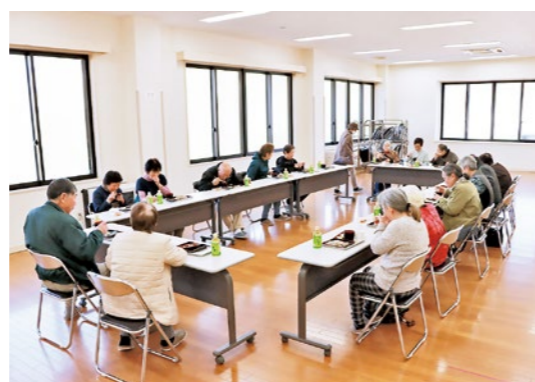
多くの来場者で賑わった会場

当日は町内外から多くの方が来場し、おいしい新そばに舌鼓を打ちました。来場者は小坂産の風味豊かなそばを堪能したほか、手作りの手芸品を買い求めるなど、そば祭りを楽しみました。