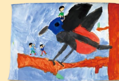
『鳥とぼくの大ぼうけん』 五十島 尊