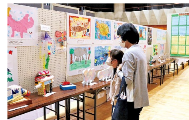
▲総合展示では各団体の力作が勢揃いしました

レースはコロナ禍の影響で4年ぶりの参加となった「公立藤田総合病院」が終始上位をキープし、みごと優勝に輝きました。また、仮装でレースに臨んだ「県北浄化センター」には盛り上げたで賞が贈られました。