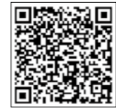
【掲載場所はこちら】