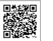
【申し込みフォーム】

Email:houkagojuku.halu@gmail.com TEL: [中学部] 080-7236-6232 / [小学部] 080-9151-6442 ※12:30~21:30 土日祝日、年末年始を除く。