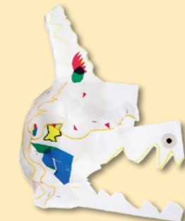
『きょうりゅうじだい』 阿部 玄徳