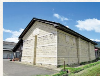
旧小坂村産業組合石蔵は2度の地震で大きな被害を受け除却を余儀なくされました

しかし、文化財を考える上での大きな課題の一つとして、これらをどのようにまちづくりに活かし、どのような形で後世の人々に町の歴史遺産を残していくのか、それらを考えなければなりません。