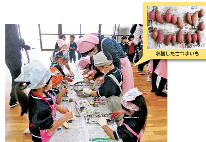
育てたさつまいもでカレーを作ろう(年長児)

■町では食生活改善推進員の皆さんと栄養士が出向いて、くにみ幼稚園の子どもたちを対象に食育教室を開催しています。10月・11月の食育内容をご紹介します。