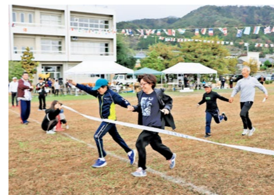
地域みんなで絆を深めました