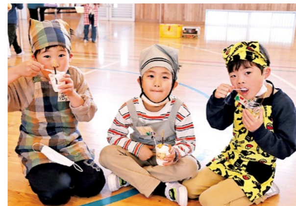
▲みんなで楽しくおやつを食べました