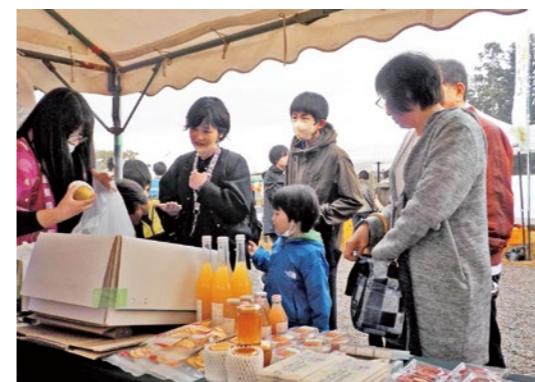
国見の味自慢を求めて多くの人が訪れました