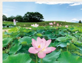
中尊寺ハスと阿津賀志山防塁のコントラストが人々を魅了します

今では、この地区は年間1万人近くが訪れる町を代表する観光地に変わりました。町では、引き続き地域の皆さまと連携し、歴史的遺産が持つ「チカラ」をさまざまな手法によって引き出すことに取り組んでいきます。