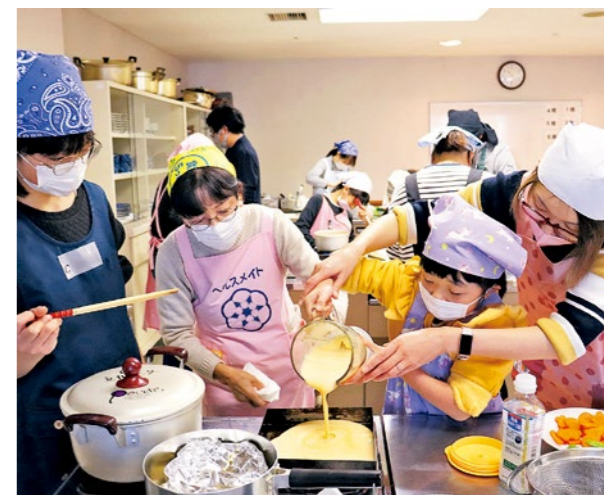
▲伊達巻作りに挑戦

E-mail : shogai@town.kunimi.fukushima.jp