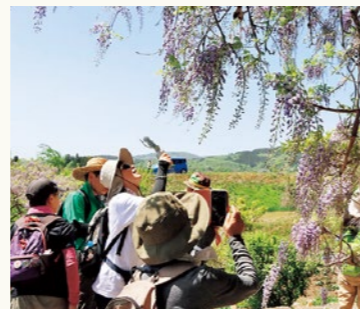
▲深山神社の大藤をパシャッ！