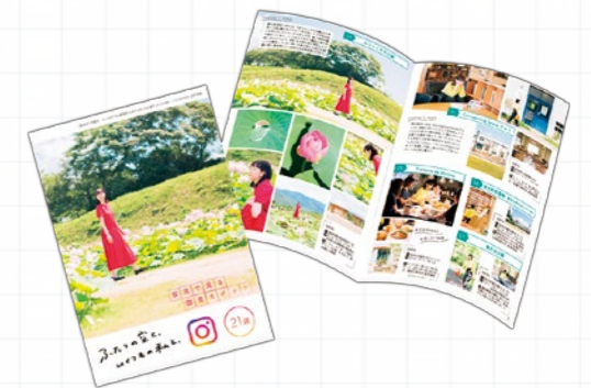
▲こちらの冊子の「春夏秋冬・総集編」も制作予定