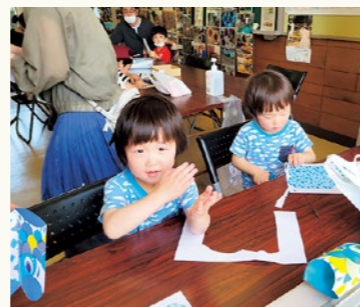
▲みんなでワークショップ楽しむ