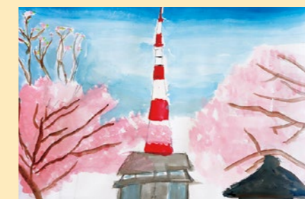
中條 恵都 【東京タワーと民家に見える桜の風景】