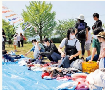
▲おさがり交換会では子ども服が人気

次回の七夕イベント(7月下旬予定)も親子で楽しめる内容を企画しています。ぜひご参加ください。