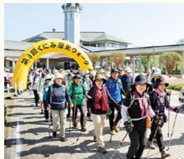
▲晴天の中スタートする参加者たち

深山神社の大藤も今回の歴史ウォークに合わせるかのように開花を迎え、滝のような鮮やかさで参加者を楽しませてくれました。