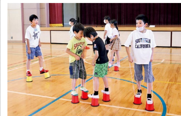
▲パカポココレース

5月25日の第1回活動では「パカポココレース」や「9マス鬼ごっこ」などの遊びを行い、3年生がリーダーとなって、楽しく活動しました。