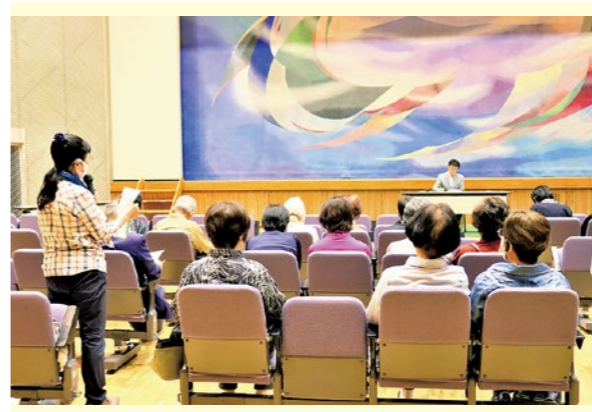
▲町長と意見交換をする受講生