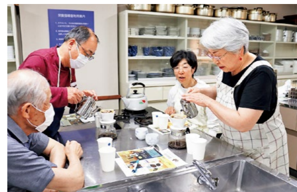
▲ペーパードリップで丁寧に珈琲を淹れる参加者たち