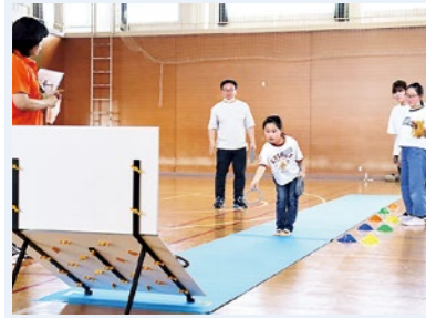
▲ニュースポーツのクロリティーに挑戦！