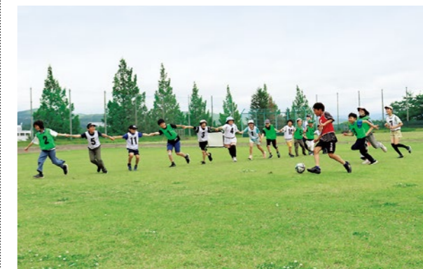
▲全員がキーパー！手をつないでゴールを阻止！

32人の教室生が参加し、試合では点数を競いながら元気いっぱいにボールを追いかけていました。