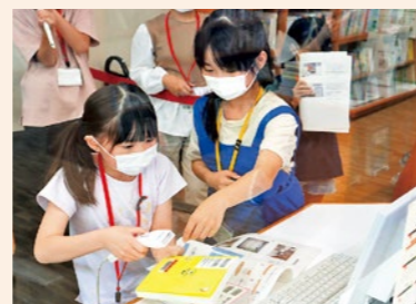
▲図書システムを操作する受講生

子ども司書講座の開講式が6月8日に行われ、受講生4名が参加しました。第1回講座では、図書館司書から「専門職の仕事」の話と「カウンターでの仕事」を体験しました。受講生はメモを取りながら熱心に話を聞き、図書システムを使用した業務体験では落ち着いて操作していました。