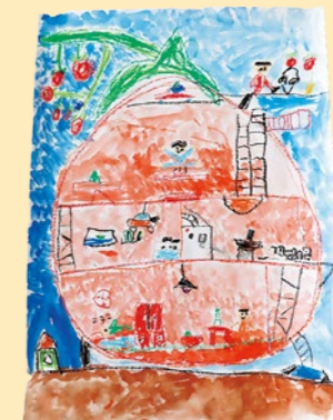
2年生 東海林 一英【トマトのおうち】