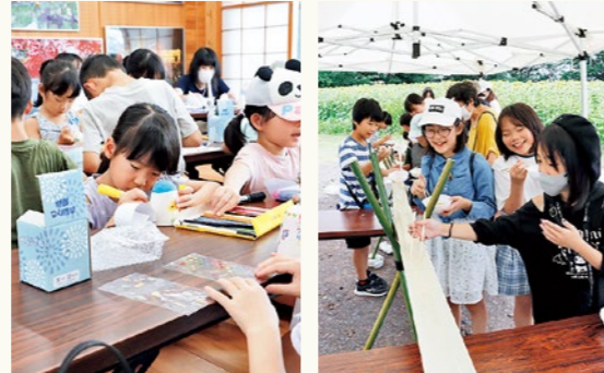
▲絵を描いて風鈴づくりに挑戦！ ▲流しそうめんを楽しむ子どもたち