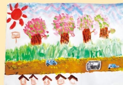
3年生 阿部 玄德【しば田の千本桜】