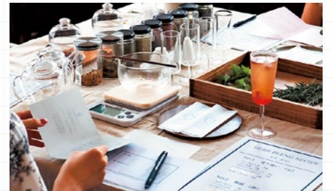
▲奥山家住宅でのワークショップ「ときほぐす」開催予定