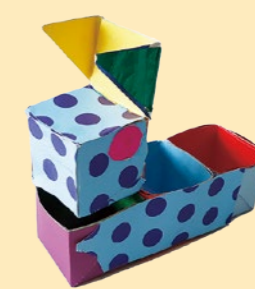
4年生 松浦 蓮【いろいろな小物入れ】