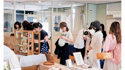
▲7月に開催した「日常市～満草～」

7月に藤田駅前の「アカリ」で、草木をテーマにサロンや焼菓子店、草木染めの作家を招いてマルシェを開催しました。9月には、国登録有形文化財「奥山家住宅洋館」を会場にハーブや香りをテーマとしたワークショップの開催を予定しています。情報はInstagramで公開しますので、ぜひフォローしてみてください！