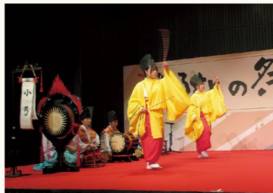
▲「小弓」「日本尊」の2演目を披露

今年も9月から開講している「子ども太々神楽教室」には、14名の児童が参加しています。