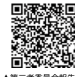
▲第三者委員会報告書