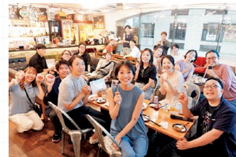
▲東京都赤坂で開催したイベント 参加者の中には近日に国見町に訪れる予定の方も

活動の様子はInstagramで確認できます。引き続き見守っていただくと幸いです。