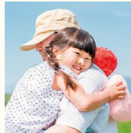
(作者不詳とされるこの詩は、数年前から SNS で広まり、世界中の子育て世代から共感を得て話題となっています。)

寝る前に絵本を読み聞かせて、汚れた顔を拭い てやるのもこれが最後 子どもが両手を広げてあなたの胸に飛び込んで くるのもこれが最後 だけど「これが最後」ということはあなたには 分からない それがもう二度と起こらないのだと気づく頃には すでに時は流れてしまっている だから今、あなたの人生のこの瞬間にもたくさ んの「最後」があるこ とを忘れないで あと1日でいいから、 あと一度きりでいいか らと願うような 大切な「最後のとき」 があることを