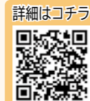
※1 ふくしま移住希望者支援交通費補助金(福島県ホームページ)