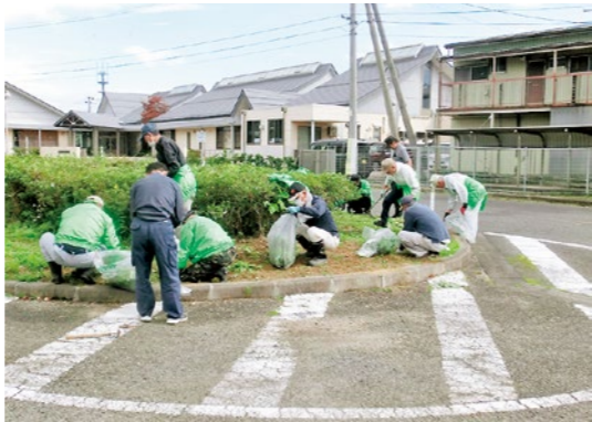
清掃奉仕活動に汗を流す会員の皆さん（藤田駅周辺）