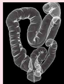
▲大腸CT検査による3次元画像

当院では、大腸CT検査(CTコロノグラフィ)を始めています。大腸CT検査は、大腸に炭酸ガスを注入し、腸管を膨らました状態でCTを撮影し、3次元画像を作成し、特殊な解析装置を用いて、大腸の病気を診断します。痛みはほとんどありませんので、内視鏡検査に抵抗のある方や高齢の方におすすめです。ただし、腸管内をきれいにするために検査前日の検査食や下剤が必要です。ご希望の方は、当院の消化器科を受診してください。相談のうえ、最適な検査法を計画します。検診要精密検査の結果報告書をお持ちいただければ、紹介受診重点医療機関における選定療養費は発生しませんので、精密検査をぜひ受けてください。