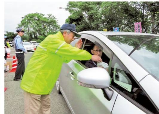
安全運転を呼びかける参加者の皆さん

第18回市町村対抗軟式野球大会の1回戦が9月23日にあづま球場（福島市）で行われ、鮫川村と対戦し9対11で勝利し、3年ぶりの初戦突破となりました。9月28日に2回戦が行われ、小野あぶくま球場（小野町）で西郷村と対戦しました。試合は、投手戦となり、最終回に1点を返すもあと一歩届かず2対1で惜敗。試合に敗れはしたものの、最後まで粘り強い戦いに温かい拍手が送られ、健闘をたたえました。