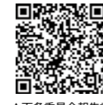
▲百条委員会報告書

町がこれまで取り組んできた防災ゼリーや高規格救急自動車研究開発事業（以下「本事業」という）に対して多くのご指摘があったため、町は、客観的で中立的、そして専門的な視点から本事業を検証するため、国見町事務執行適正化第三者委員会（以下「第三者委員会」という）を設置しました。また、町議会は本事業に官製談合防止法違反の疑いがあるとして高規格救急自動車研究開発事業事務調査特別委員会（以下「百条委員会」という）を設置し、検証をしてきました。百条委員会は7月に、第三者委員会は9月にそれぞれ報告書を取りまとめて町へ提言しました。提言の内容は下表のとおりです。また、町ホームページでも確認できます。