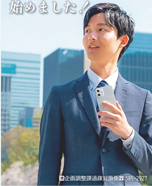
企画調整課過疎対策係 ☎ 585-2927