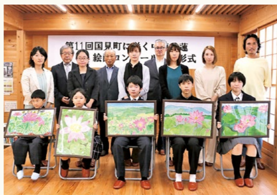
▲各部門で最優秀賞を受賞した皆さん

各部門の最優秀賞、優秀賞作品は、町ホームページに掲載しています。ぜひご覧ください。