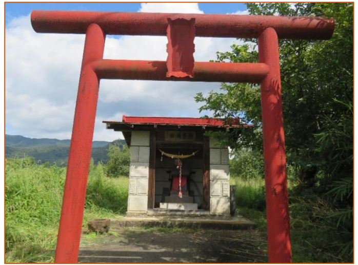
御霊神社 森山字下上野地内