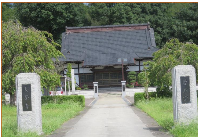
曹洞宗天祥山長栄寺本堂