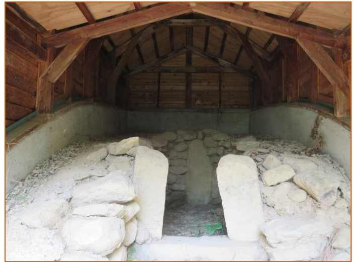
森山古墳群4号墳(森山字上野薬師) 横穴式石室が残る