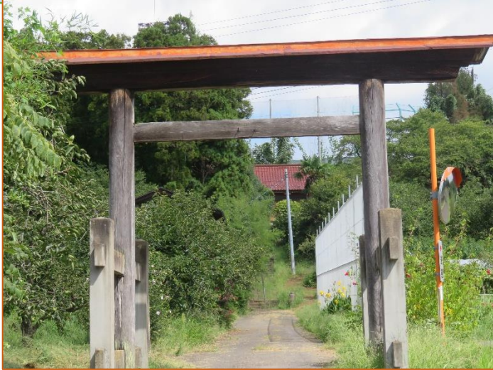
神明神社(森山字上野台) 森山村の旧村社