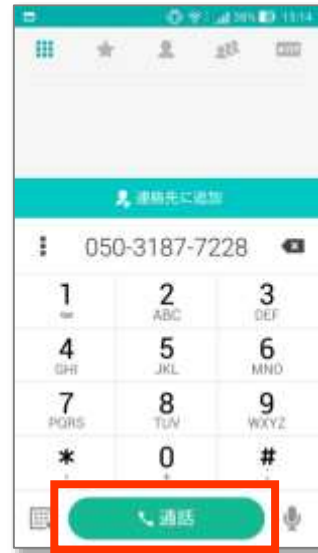
③「通話」ボタンを押します