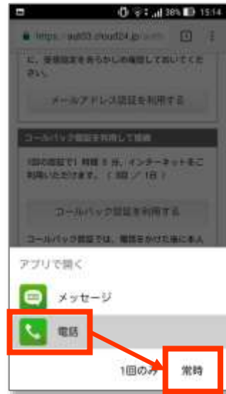
②「電話」アプリを選択し、「常時」ボタンを押します