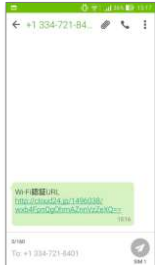
⑥届いたSMSメッセージを選択し、本文に記載のURLを押します