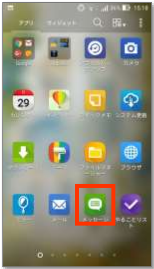
⑤「メッセージ」アプリを押します