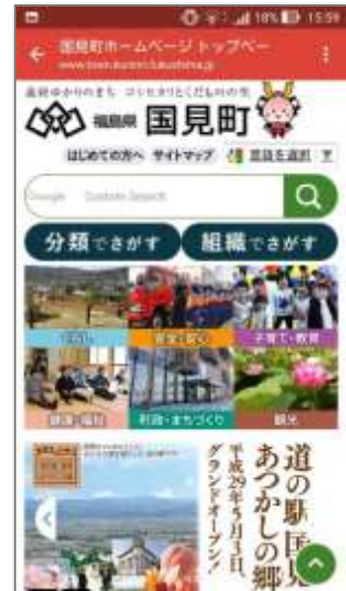
⑦認証が完了し、インターネット接続が可能となります