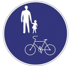
自転車歩道通行可の標識▶