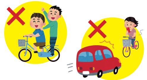
【福島県・国見町交通対策協議会】