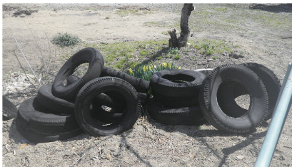
不法投棄はダメ！ゼツタイ！