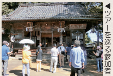
▶ツアーを巡る参加者

藤田地区を主な会場として開催された義経まつり。国見町の歴史の一部を、町内外へ伝える機会となりました。