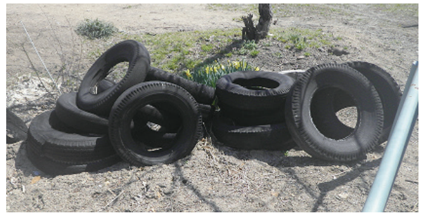
不法投棄はダメ！ゼツタイ！