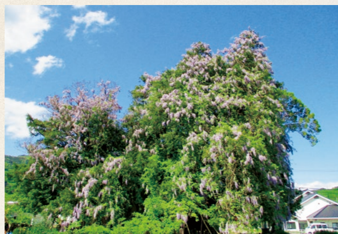
青空のもと満開に咲き誇る大藤

新型コロナウイルス感染症による影響で、外出自粛のため直接見ることができなかつた方も多いと思いますが、『妹が家に伊久里の杜の藤の花今来む春も常かくし見む』(「万葉集」第17巻3952番歌)と詠まれているように、いつも変わらず咲く、華やかで美しいその姿を来年は現地で見なさまに見ただけ祈っています。