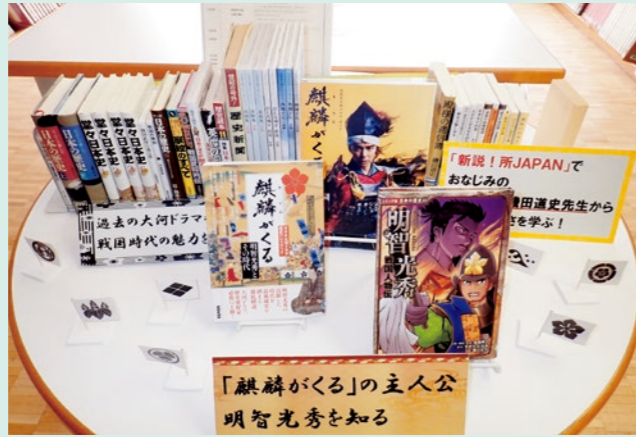
※貸出期間は20日間。当面の間は10冊まで貸出します