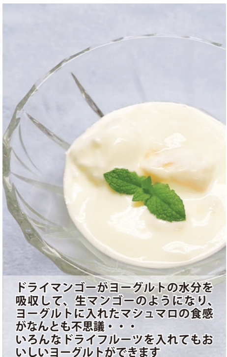
ドライマンゴーがヨーグルトの水分を吸収して、生マンゴーのようになり、ヨーグルトに入れたマシュマロの食感がなんとも不思議・・・いろいろなドライフルーツを入れてもおいしいヨーグルトができます

② 冷やしたヨーグルトのマンゴーが柔らかくなった器に盛り、ミントの葉を添えできあがり。