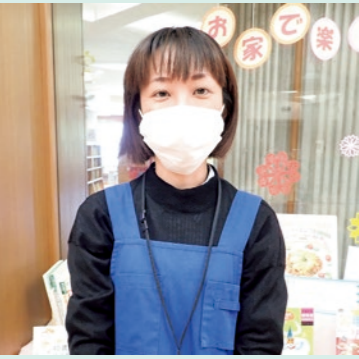
図書室司書より 「知れば知るほど面白い！ 歴史に興味を持つきっかけとなっただければうれしいです」