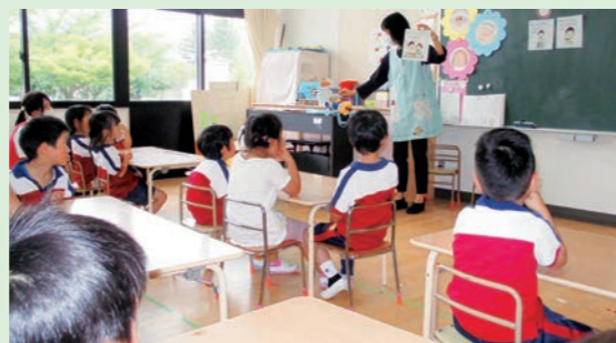
ごはんを食べるときのお約束は(年中組)