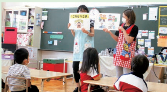
「食事のあいさつ」について考えよう(年長組)

町では、食生活改善推進員のみなさんと栄養士が、くにみ幼稚園の子どもたちを対象に食育教室を開催しています。6月は年長・年中組で「食事のマナーについて」をテーマに開催しました。