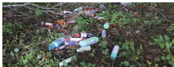
不法投棄はダメ！ゼッタイ！