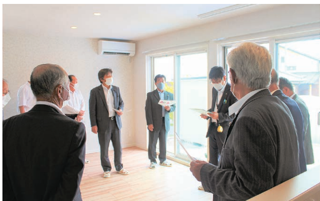
▲子育て住宅について建設課長より説明を受ける

なお、調査日時点で、全4戸中2戸入居済み、残り2戸について入居者募集中という状況でした。