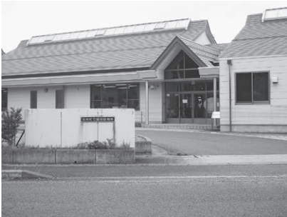
認定こども園を検討している藤田保育所⑤とくみにみ幼稚園

教育長 園児数の減少は、集団での活動等を難しくし、小中学生の減少は、クラスの減、教員定数