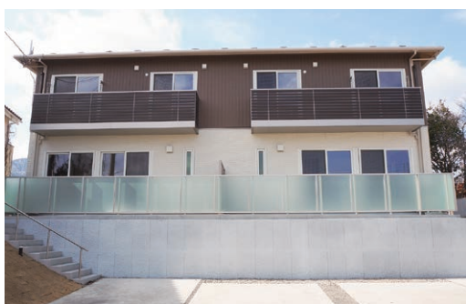
子育て住宅2号棟▶ 外観

参議院選挙が終わり、各政党の議席数が確定しました。今回の選挙は、とくに今後の政治の流れを左右する重要な選挙であったと思います。