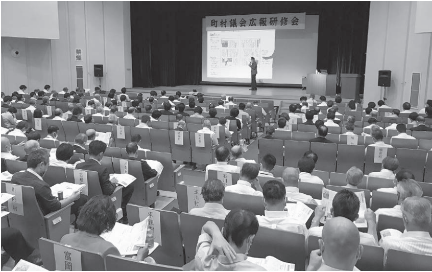
福島市で開催された町村議会広報研修会

議会広報紙は、まずは住民に分かりやすく、住民目線で専門用語を省き、気軽に読んでいただくことが大切です。そのためには、住民との意見交換等を通じ、その意見から課題や問題点を見つけ出し、行政に政策・