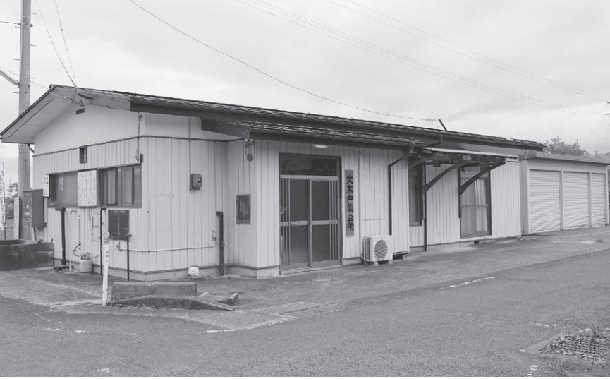
改修費補助が計上された大木戸集会所