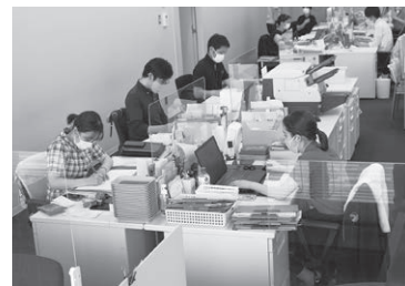
公金振込事務を担当する会計課