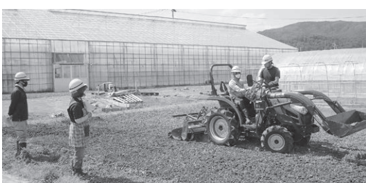
将来の農業経営者を育成する農業ビジネス訓練所

町長 10年、20年後の国見町の農業を考えたとき、画期的な施設と考える。農業を辞めてしまう人が上回るかもしれないが、着実に農業後継者を確保する施設になると考えている。